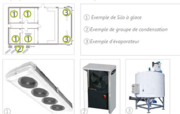
Figure 1 : Plan