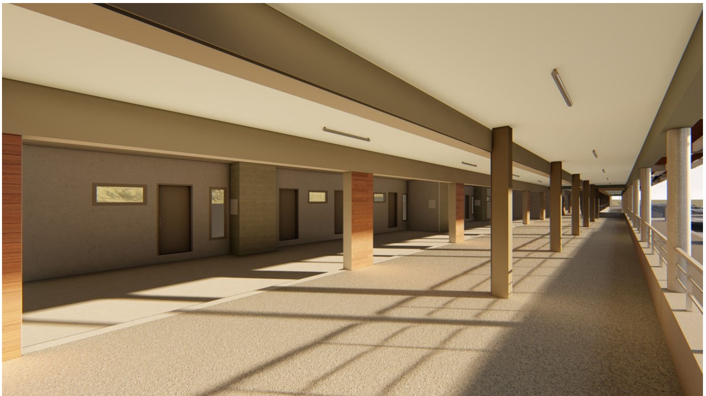
Figure 3 : Vue d'ensemble virtuelle