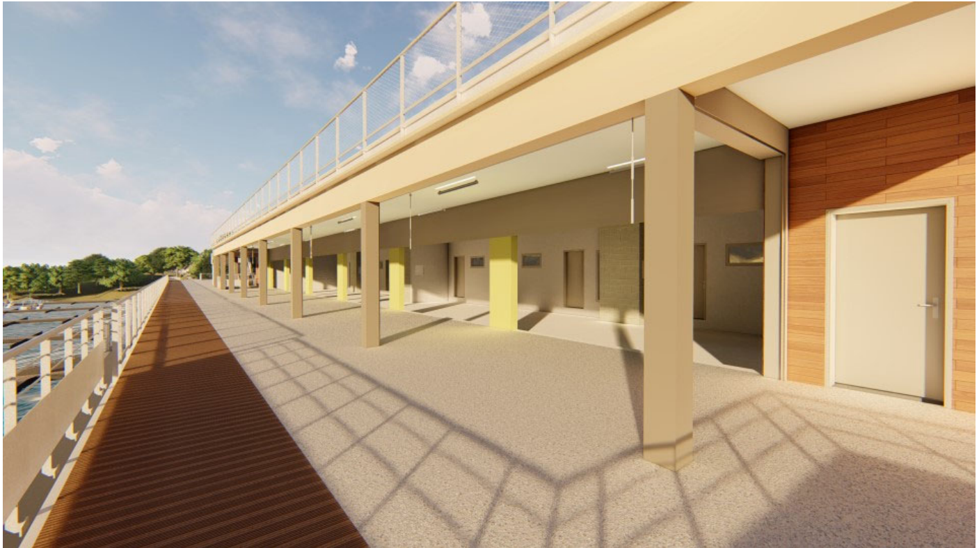
Figure 3 : Vue d'ensemble R+1