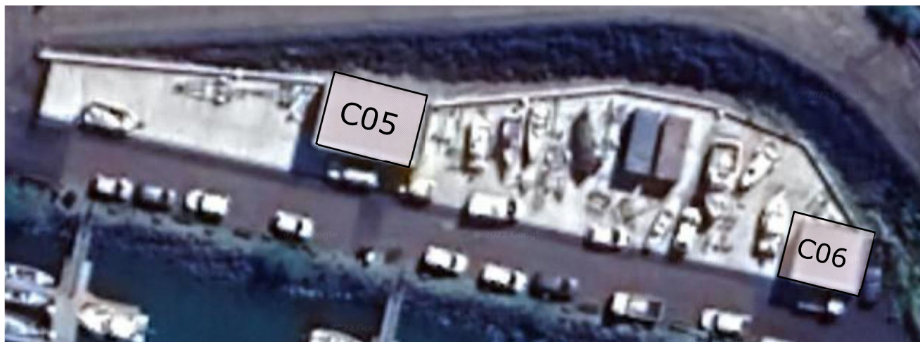
Figure 6 : Vues des lots C05 et C06