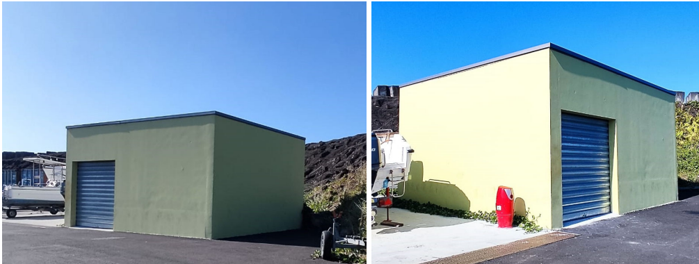
Figure 1 : Lot C06